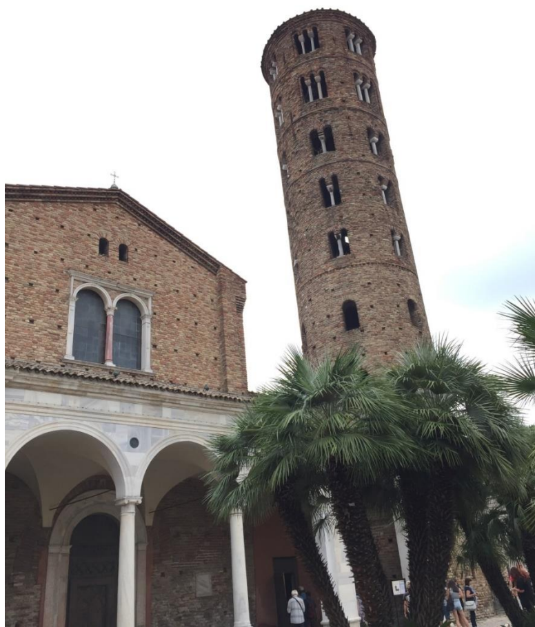
žáci a učitelé 4. ročníku

Nevídané architektonické památky, krásná příroda, uvolněná atmosféra italských měst, vstřebávání nových dojmů, kultury, jazyka a dobrá nálada, tak vzpomínáme na naši exkurzi.