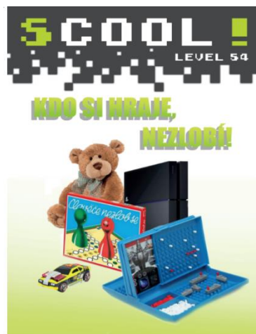
ukázky titulních stran časopisu