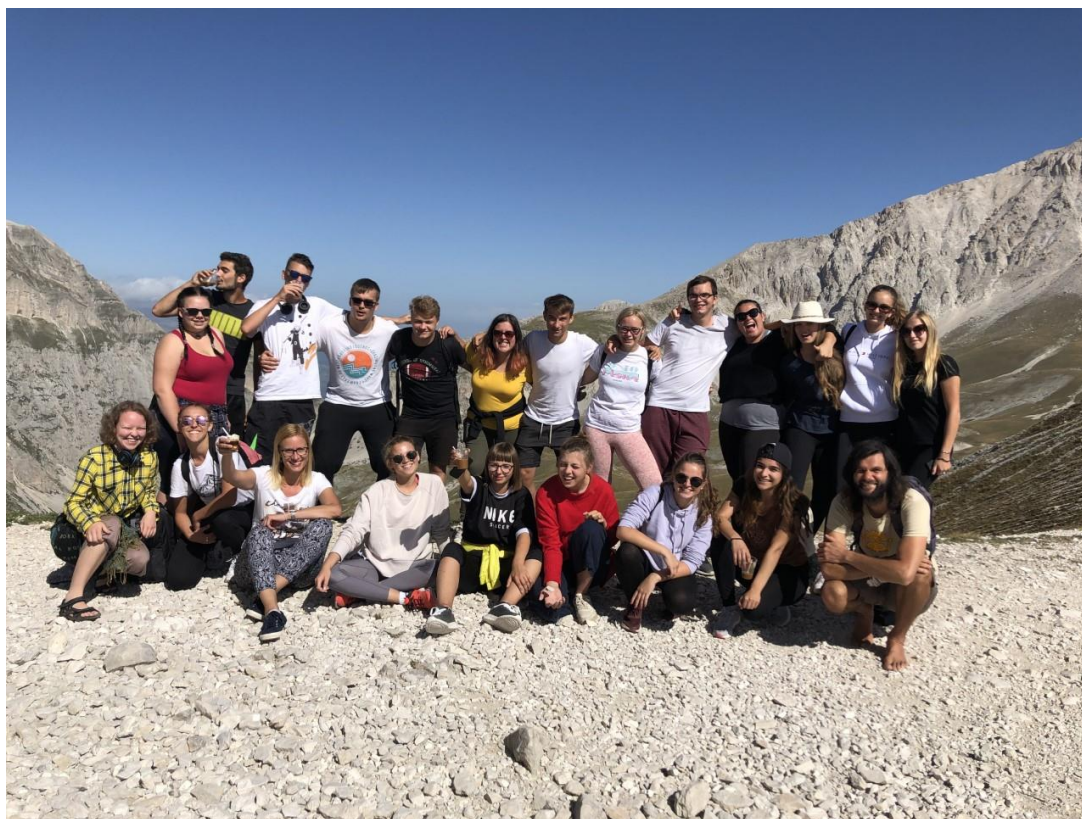
žáci a učitelé sexty

vzniká olivový olej a další olivové produkty. Dny volna strávené v blízkosti Jaderského moře a italské sluníčko nám zpříjemnili poslední letní dny před blížící se maturitou.